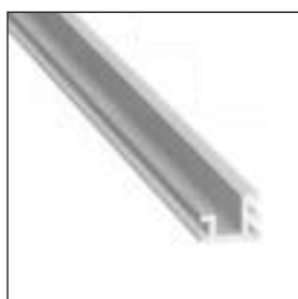
Уплотнитель под разделительный профиль для узких систем MS 161, MS 162, MS 163, MS 164