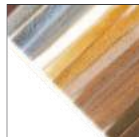
Уплотнитель щеточный (ворс) цвета в ассортименте