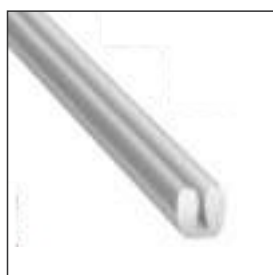
Уплотнитель под стекло MS 10/4