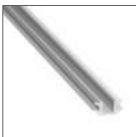
Уплотнитель под разделительный профиль для узких систем MS 161, MS 162, MS 163, MS 164