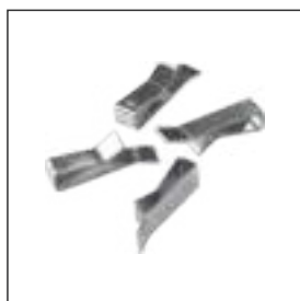
Зажимы для ворса